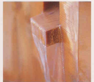
泉質・効能にすぐれた天然温泉