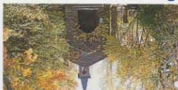
6 安曇野・碓氷美術館