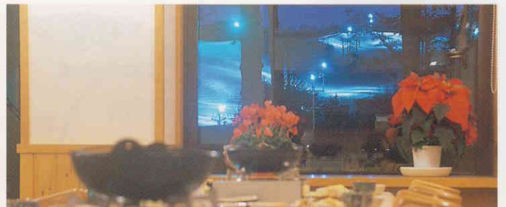
ナイターゲレンデを眺めながらのディナー。

その日いちばんの素材をもとにお料理をコーディネートし 朝からたっぷり時間をかけて味を仕込みます。 オリジナルのレシピから作る、森の味わいをお楽しみください。