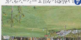
4 いかやしクリエイティブ