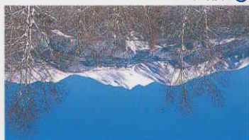
1 新穂高ロープウェイ

乗鞍高原、上高地はグーテヴェルからほど近く、北アルプスを買ぐ安房ノネルを走れば、岐阜県側の新穂高温泉郷、飛騨高山も楽しいドライブコースです。スキーやトレッキング、歴史探訪、秘湯巡りなど、ますます魅力の大自然が身近になりました。