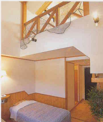
木の香りが清々しいゲストルーム