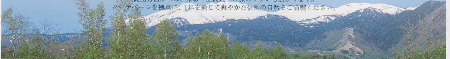
新緑に映える雪の乗鞍岳

身近な四季の素材を上手にアレンジし 丹念に工夫を凝らしたオリジナルメニューが朝夕のテーブルを美味しく飾ります。 標高1,300m、乗鞍岳の東斜面に広がる雄大な乗鞍高原に位置し 春から秋の散策、冬にはスキーがお楽しみいただけます。 また、安房トンネルを利用すれば、松本方面からは新穂高・飛騨・高山へ 高山方面からは、乗鞍・上高地への旅のプランも広がります。 グーテベレを拠点に、1年を通じて爽やかな信州の自然をご満喫ください。